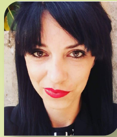
SANTA SARTA , Sant'Alessio Siculo (Messina)